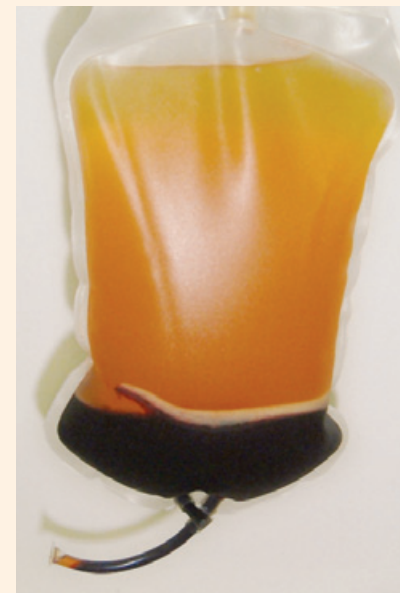
Abbildung 1: Auftrennung einer Blutspende durch Zentrifugation in Plasma (oben), Erythrozyten (unten) und dem dazwischenliegenden Buffy Coat

Aus den isolierten Buffy Coats (sie enthalten neben den erwähnten Leukozyten und Thrombozyten noch restliche Erythrozyten sowie Plasma) werden Thrombozytenkonzentrate (TK) hergestellt. Sie werden zur Behandlung von Blutungen eingesetzt, die auf einem Thrombozytenmangel beruhen, ferner zur Blutungsprophylaxe bei thrombozytären Bildungs- oder Umsatzstörungen (1,2).